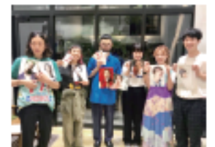
社内フォトコン 毎年行われる社内フォトコンで素敵な作品が沢山!!