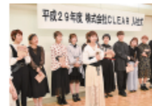
入社式 入社式毎年沢山のCLEAR仲間が入社します