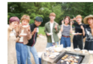
BBQ スタッフとのコミュニケーションを深めるBBQ!!